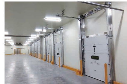
▲オーバードアスプリングレス方式を初導入(スプリングを使用しない駆動装置を搭載)耐久性が大幅にアップ