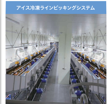
▲アイス冷凍集品ラインピッキング作業風景

イバープレミアムII)を導入することにより、リアルタイムでモニターの監視管理が確認できます。弊社エンジニアリング部門は、同センターの冷凍冷蔵庫、冷凍パレット自動倉庫、アイス・冷凍集品ライン、冷凍シャトルラック、庫内LED照明などさまざまなお手伝いをさせていただきました。