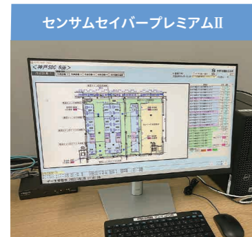
▲冷凍・冷蔵庫の集中監視システム (センサムセイバープレミアムII)