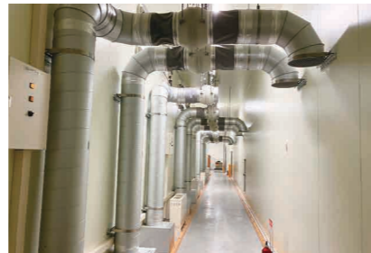
▲冷凍パレット自動倉庫用凍上防止システム 冷凍庫用凍上防止対策として 床下換気ファンダクト式を導入