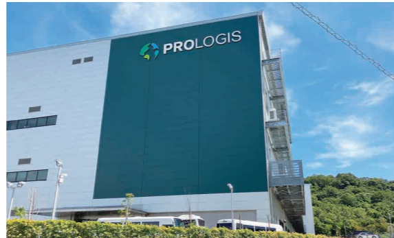
▲「コープこうべ見津が丘冷凍集配センター」全景

具体的には、商品の仕分けラインを従来の3本から4本に増やし、取扱可能アイテムも300から600へと倍増し、さらに離乳食や介護食などが新たな品揃えに加えられました。