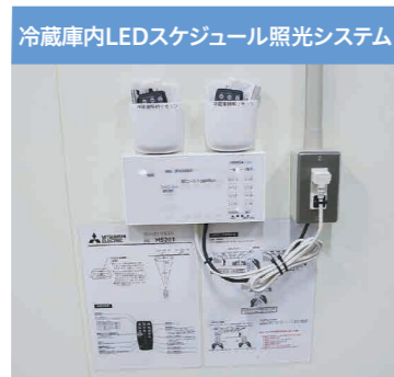
▲冷蔵庫内LEDスケジュール 照光システムコントローラ