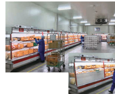
▲小分け用に冷凍ショーケースを導入(オートエコEVスクリーンを搭載)