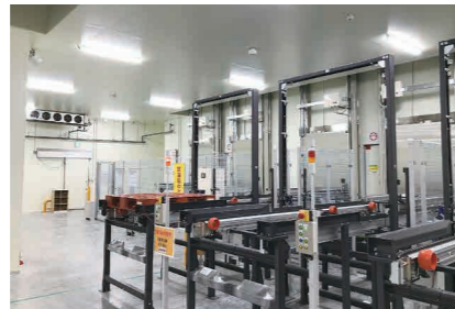
▲冷凍パレット自動倉庫コンベア前