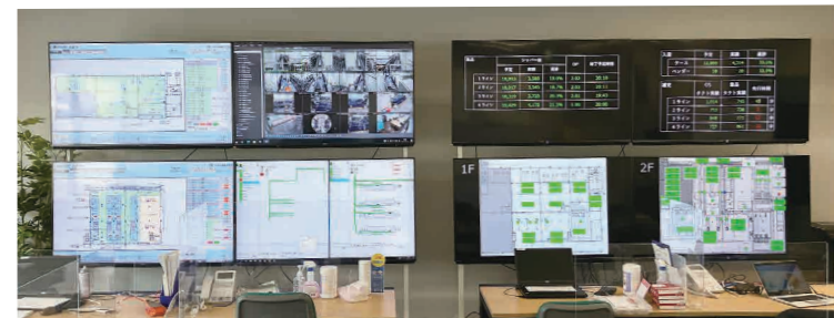
▲モニターでセンター全体を一括管理システムを導入